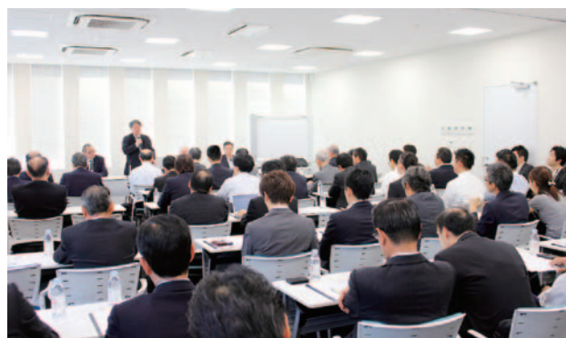
多くの業界関係者が集まり、活況を呈した

Q シェアサイクルの使用目的、都市交通における位置づけを具体化、明確にする必要があるのではないか。