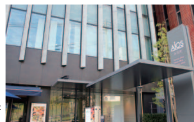
協会キックオフが行われたAios永田町